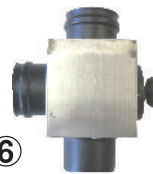
オリジナルクロス管